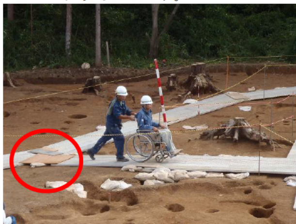
ベニヤ板とゴム (準備中の様子)