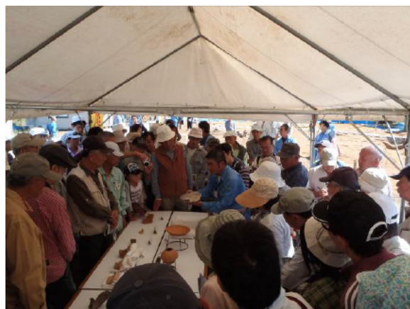
出土した弥生土器の説明