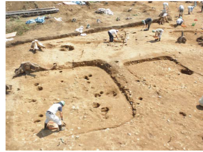
③平坦地の竪穴住居