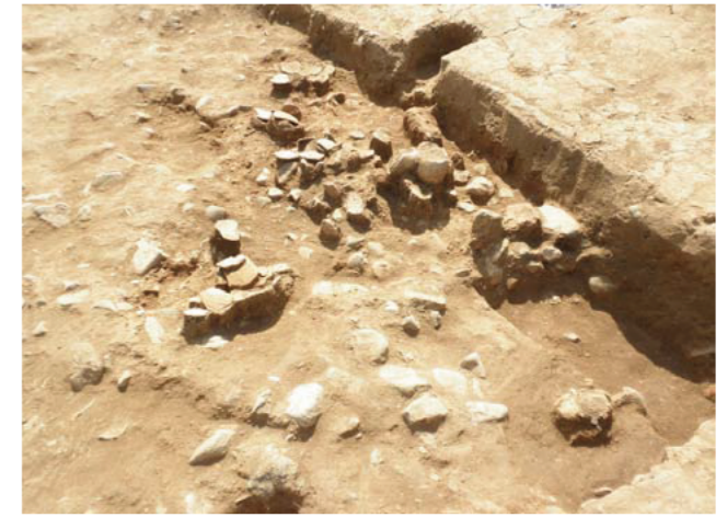
④竪穴住居 遺物出土状況