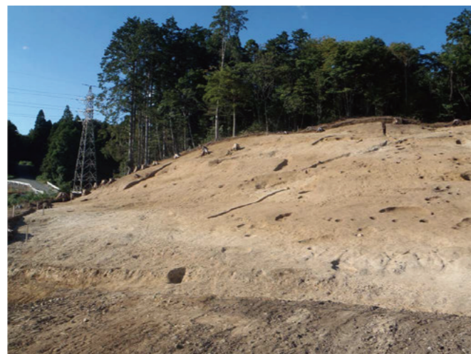
遺構完掘（斜面にも遺構が見つかりました）