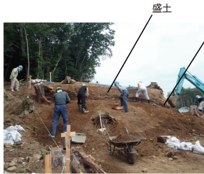
②土塁の調査の様子 ・黒い部分が昔の表土。その上に土が盛られています。