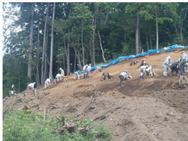
作業風景（斜面で遺構を探しています）