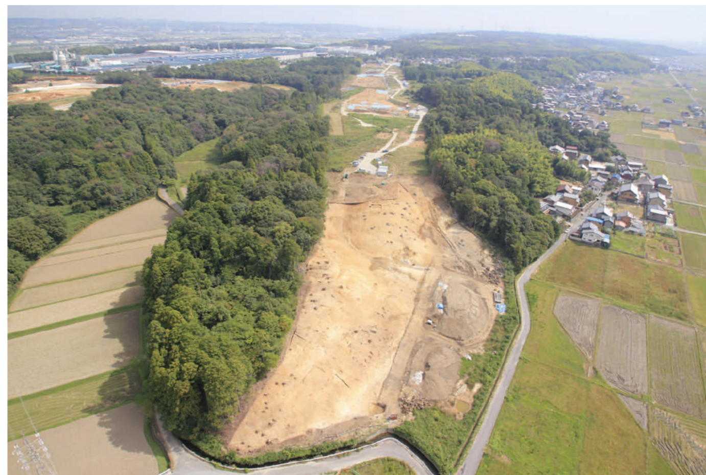
北山城跡第3次発掘調査全景（西上空から東に向かって撮影）