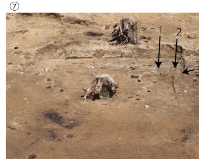
⑥⑦ 斜面の竪穴住居 ・同じ場所で溝が3条重なって見つかり、建物が建て替えられたと考えられます。