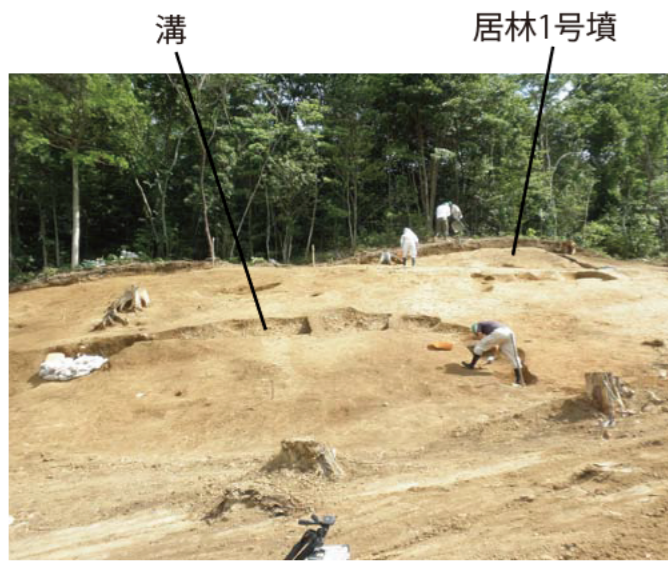
①居林1号墳とL字に曲がる溝 ・平面の形がL字に曲がる溝を斜面で見つけました。 古墳の周囲をめぐる溝(周溝)の可能性があります。