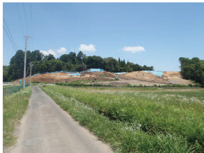
調査区遠景（調査区の大部分が斜面です）