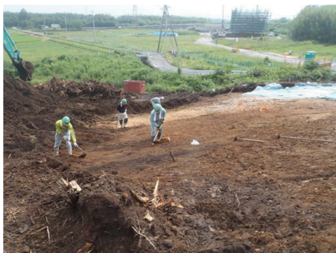
作業風景（黒いところが遺構です）