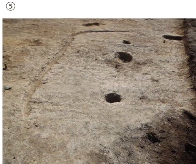
⑤ 低地部平坦地の竪穴住居 ・昨年度の調査でも、低地部の平坦地で竪穴住居が見つっています。