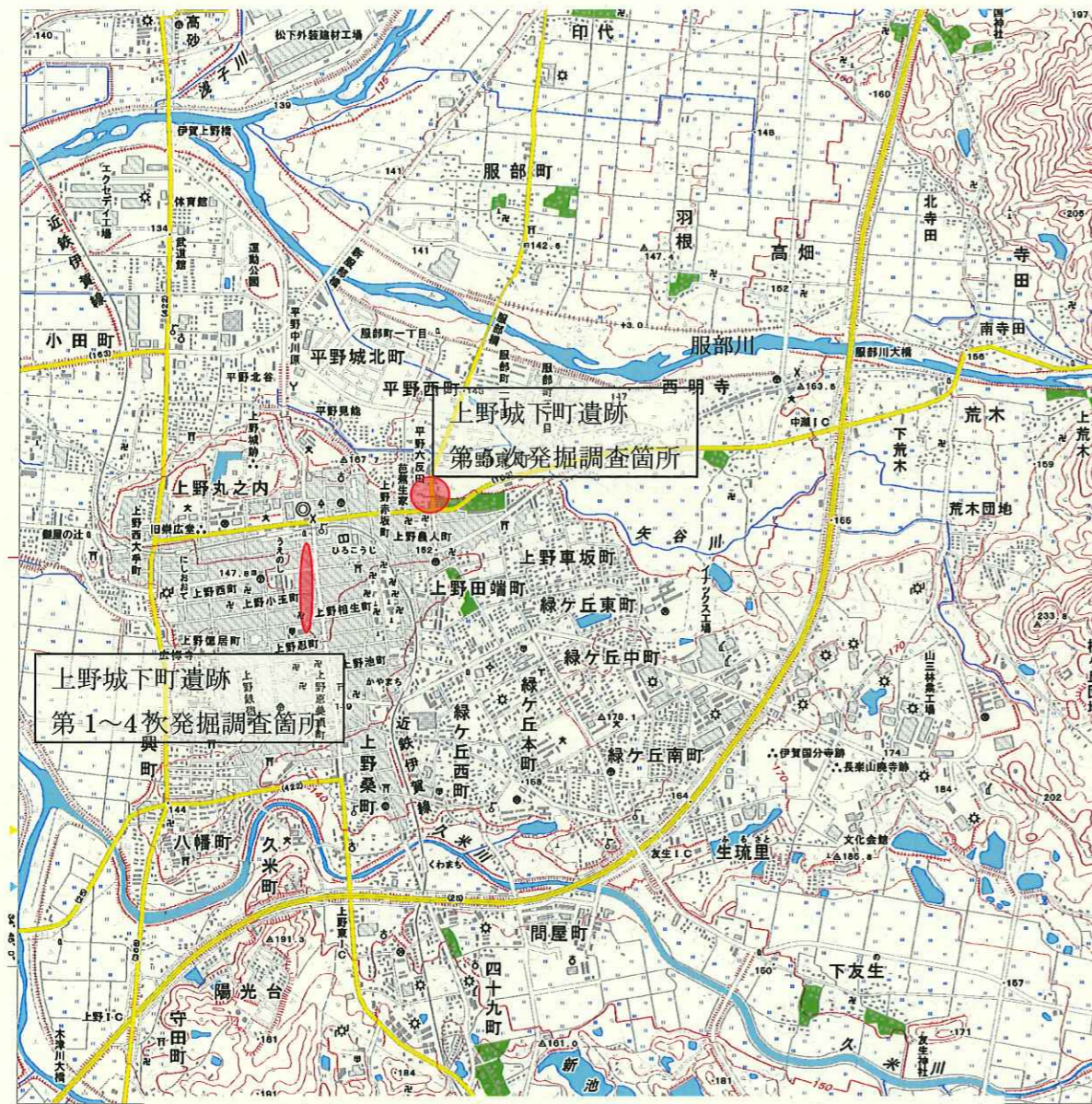
上野城下町遺跡位置図（国土地理院数値地図 1：25,000「上野」を使用）