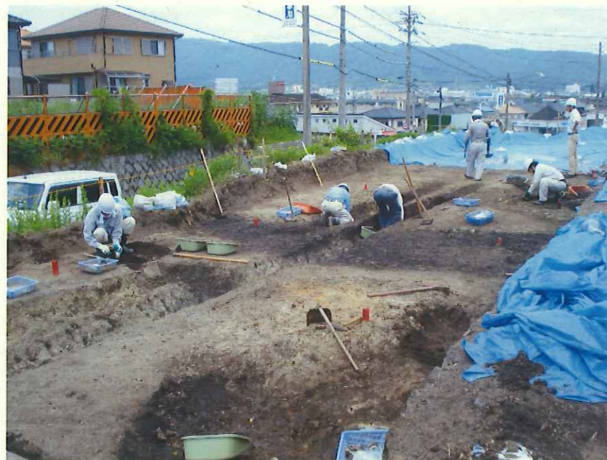
作業風景（黒い筋が周溝）