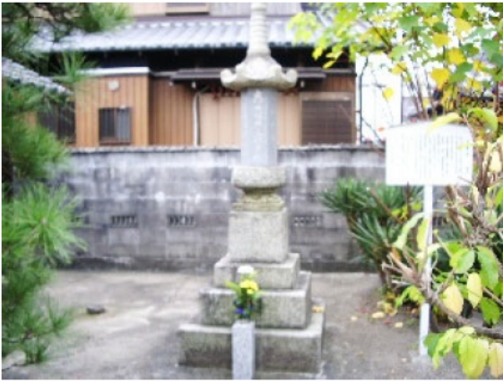
金剛寺境内南門と向かい合って建っている「虫供養塔」です。かつてはこの地域も田畑が広がる農村だったことがうかがえます。