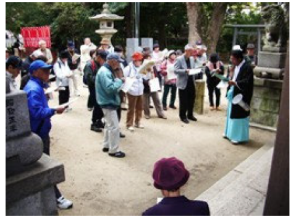
御園神社 伊勢神宮（外宮）の塩御園に由来する等の解説を宮司さん（右端）よりうかがいました。