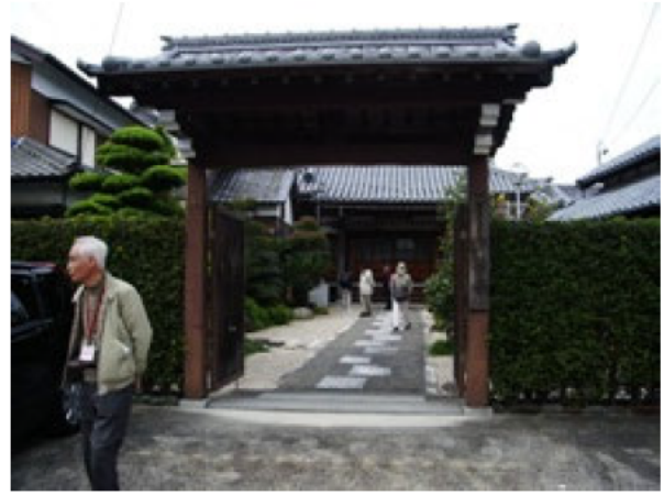
浄福寺・・・浄土真宗高田派