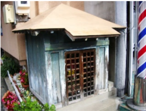
御園地蔵 意に沿わない結婚をした娘が身投げ自殺をし、両親は後生を慰めるためにお地蔵さんを祀ったという悲しい話が伝わっています。