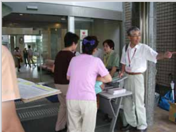
教育文化施設玄関前にて受付。

当日はあいにくの雨となりましたが、85名の参加者達は朝日町歴史博物館の学芸員より、「朝日町の歴史と東海道」について解りやすく、興味深いお話を伺った後、かつて交通の要衝だった東海道を当協議会委員の解説を聞きながら、いにしえに思いを馳せてウォークしました。