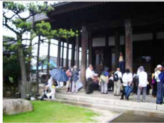
真光寺。桑名藩主、松平定重が贈った梅鉢の家紋入り大手水鉢が本堂左脇にあります。