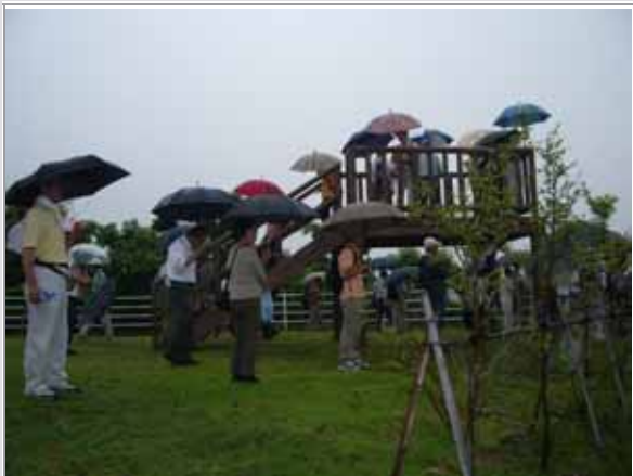
柿城跡展望台からは町の様子が一望できます。