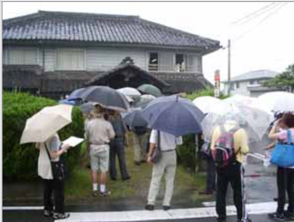
資料館。大正5年に役場庁舎として建てられました。国の有形文化財。