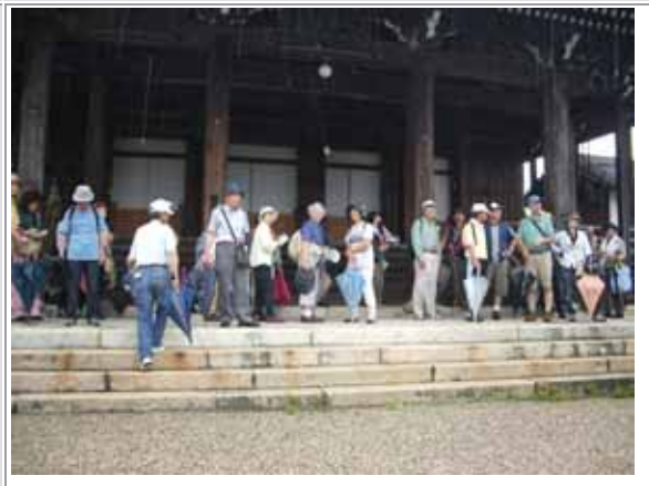
徳川家にゆかりあるお寺、浄泉坊。参勤交の大名はこの門前で駕籠から降りて黙礼したと言われています。