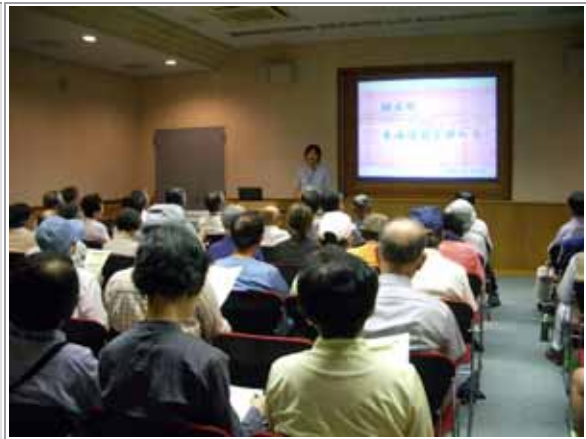
朝日町歴史博物館での講演の様子。