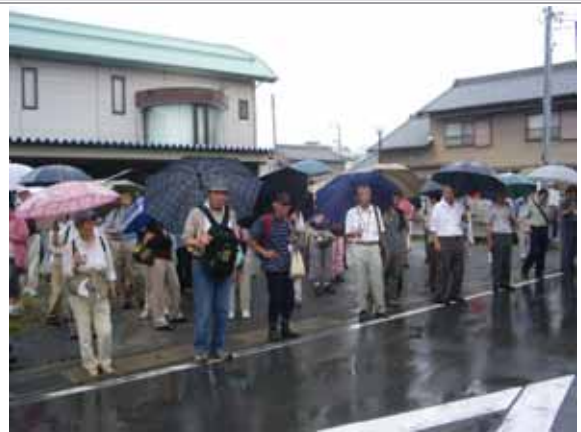
小向立場跡付近では、「蛤茶屋」が建ち並んで賑やかに客を呼びこんでいた様子などの説明がありました。