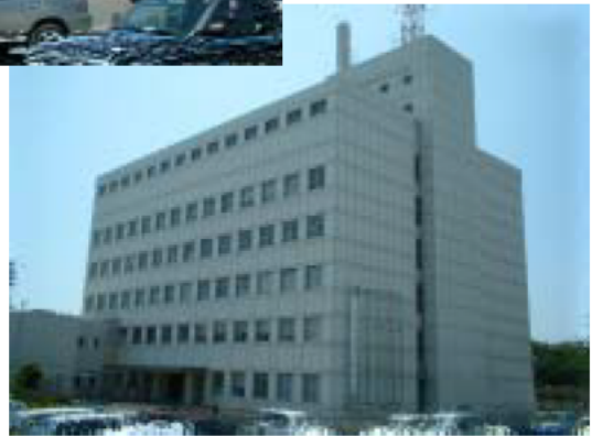
(三重県四日市庁舎)