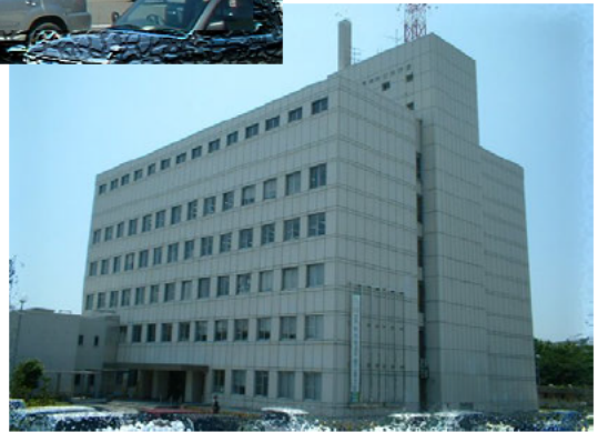
(三重県四日市庁舎)