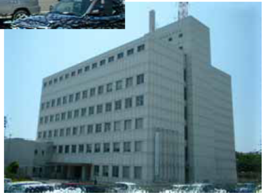
(三重県四日市庁舎)