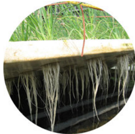
根が水に浸かっています