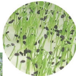
ねぎの種と芽 種はごまくらいの大きさ