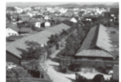
御城番屋敷 (国重要文化財)

1588年松坂開府の祖 蒲生氏郷によって築城された。現在は豪壮な石垣が残るのみであるが、誇らしげにそびえ立つその姿は松阪のシンボルの存在。桜や藤、銀杏が石垣を彩り、四季を通じて市民に親しまれている。城跡からは城下町の面影を残す町並みを一望できる。