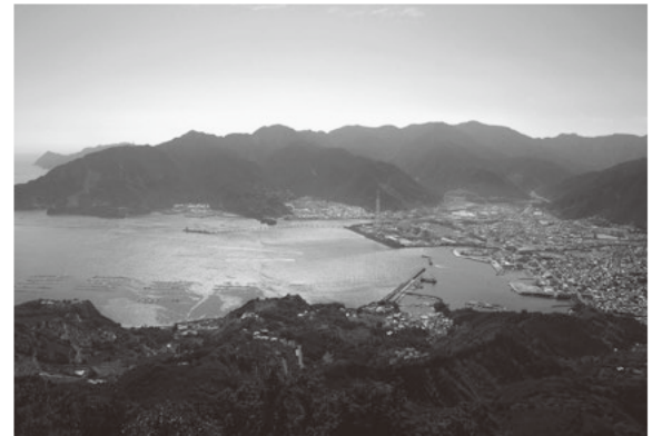
(天狗倉山山頂からの尾鷲の景色)

尾鷲市は、下の写真でもご覧いただけるように山と海に囲まれた街であり、そのため、山の幸と海の幸に恵まれた街であります。山の幸としては、全国有数の多雨地区で厳しい環境で育つ尾鷲ヒノキは強度が大きいことで知られております。海の幸としては、新鮮な魚と種類が豊富な海老類で、尾鷲の市場で上がった魚介類を提供する店舗を「尾鷲よいとこ定食」として紹介しております。海洋深層水の取水場「アクアステーション」では様々な種類の深層水の提供を行っております。さらに、深層水を利用した飲料や商品の開発も行われており、現在は陸上養殖にも取り組んでおります。