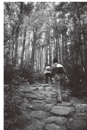
(石畳が連なる熊野古道・馬越峠)

また、熊野古道は、世界遺産に認定されてから10年目を迎え、尾鷲市では、初心者でもやさしい馬越峠や西国の難所といわれた八鬼山峠等を有し、熊野古道の情報発信基地として「重県立熊野古道センター」と、地域振興施設では地元のお母ちゃんによるランチバイキングのある「夢古道おわせ」と海洋深層水を利用した温浴施設「夢古道の湯」で観光客を癒しています。