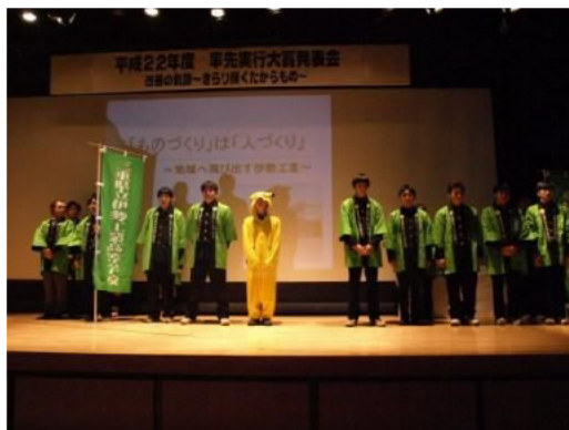
H22「伊勢工業高等学校」の発表