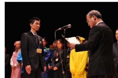
H22グランプリ表彰 (電子業務推進室)