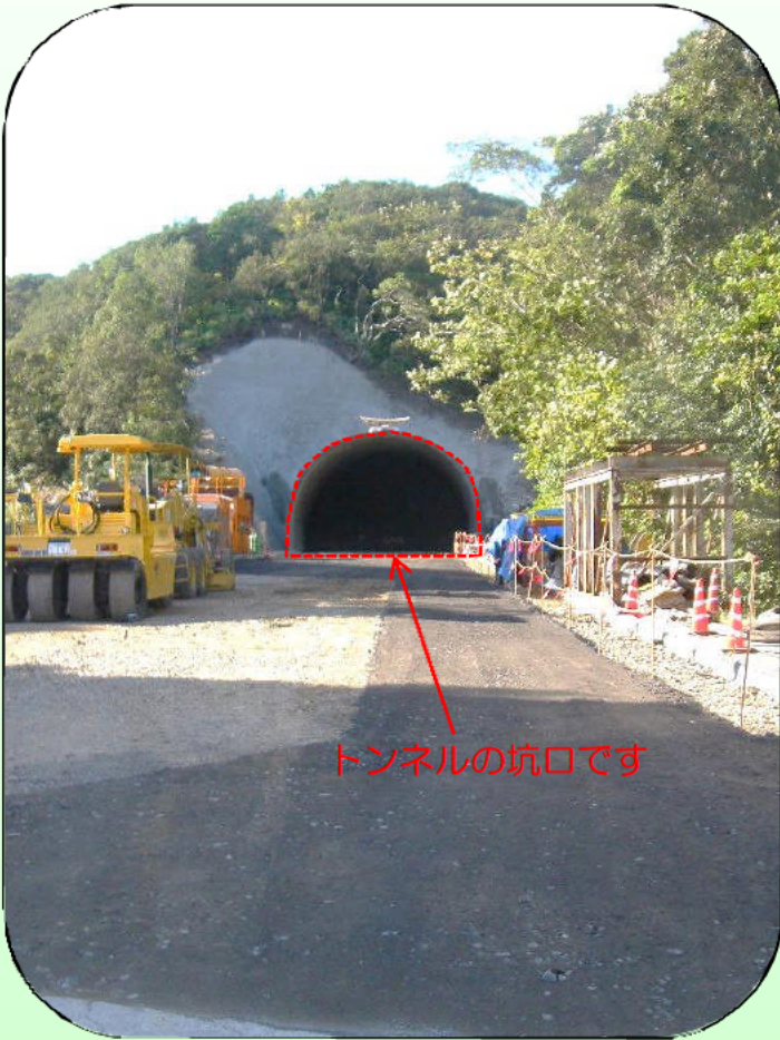
トンネルの坑口です