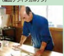
そば打ち体験（太郎生道里夢・そば道場清貧庵）