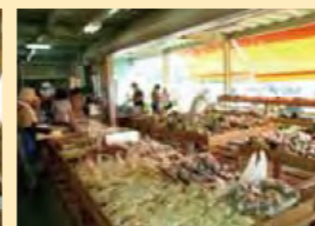
（白山ぬくいの郷直売所）