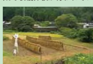
稲の収穫体験。収穫後は、「はさがけ」に（グリーンツーリズム美杉の風）

「 ③城山クライנגルテン 」では、田舎暮らし体験塾が行われるほか、オプションでさまざまな体験メニューが用意されています。「 ⑥太郎生道里夢 」では、地域内で栽培されたそばを使ったそば打ちを体験できます。「 ②白山ぬくいの郷直売所 」では、収穫時期に併せて直売所前の畑で収穫体験が行われています。