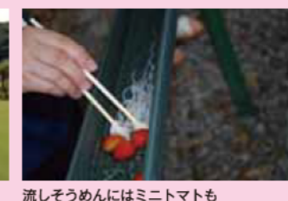
流しそうめんにはミトマトも（リバーパーク真見）