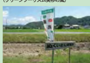
直売所前の畑で収穫体験（ぬくいの郷直売所）