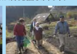
（城山クライングルテン）