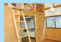
（城山クライングルテン）