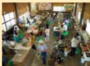
（美里フラワービレッジ）

「 ①美里フラワービレッジ 」、「 ②白山ぬくいの郷直売所 」では地元の生産者が丹精こめて作った農産物や、手作りの加工品の品揃えが豊富で多くの人で賑わいます。地元で作られた炊き込みご飯等を購入できるので、観光地へ持ち込んで食すこともできます。