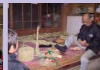
手作り小物づくり、ワラ細工（二人静・広口）