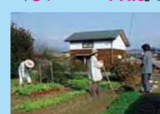
（リバーパーク真見）