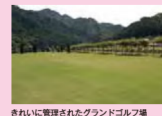
きれいに管理されたグランドゴルフ場（リバーパーク真見）

「 ③リバーパーク真見 」では、管理された芝生でグランドゴルフを楽しめるほか、バーベキュー施設もあり、デイキャンプに訪れる人も多く、また夏場には、川遊びを楽しむ人たちが賑わいます。夏の風物詩のひとつとなっている流しそうめんも楽しめます。