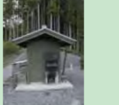
五右衛門風呂も体験（城山クライングルテン）