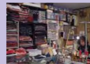
手作り小物づくり（二人静・金山）

「 ⑥太郎生道里夢 」では、個性的な展示を各家々で行われており、気軽に足を運んでいただけます。丸八に道案内の看板、道の駅美杉等で、地図が配布されています。