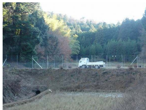
【獣害フェンスの設置】