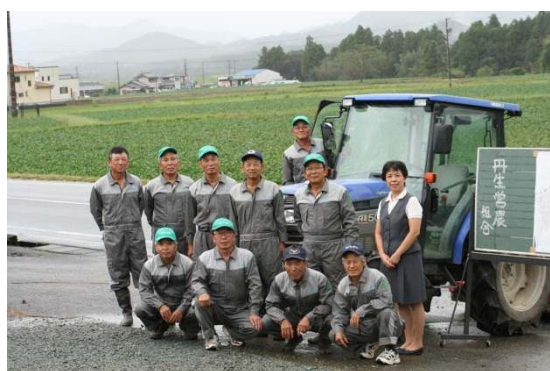
【農事組合法人丹生営農組合】

集落では深刻化する獣害の対策として、中山間直接支払交付金を一部活用して、集落13kmを囲う防護柵を設置するなど、集落マスタープランを実現するための体制整備に取り組んでいる。