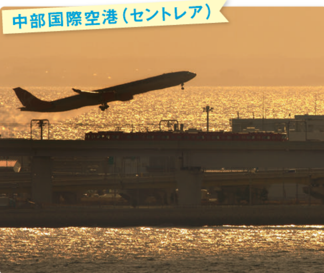
中部国際空港 (セントレア)