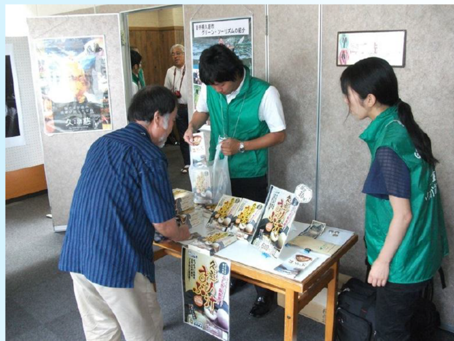
おみやげ用まめぶ汁の販売