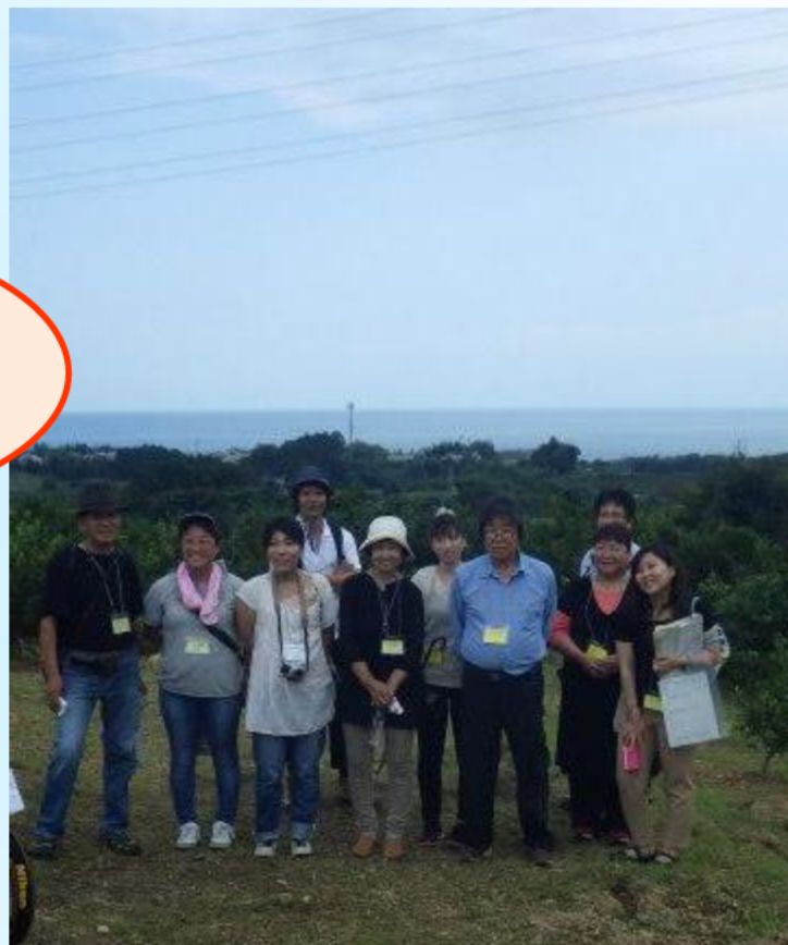
みかん園と熊野灘を背景に撮影