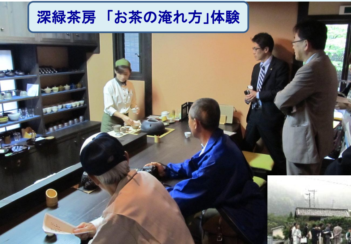
深緑茶房 「お茶の淹れ方」体験