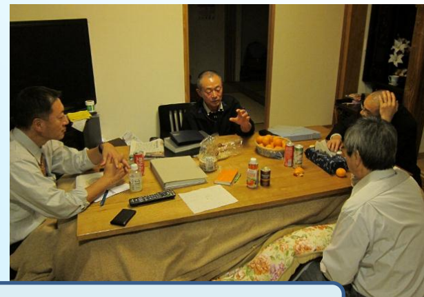
農家民泊での情報交換・交流

農村文化の継承を目的として、設立した組織。木皮細工体験や豆腐づくり体験などを行っている。