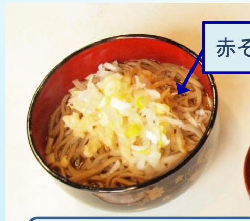
赤そば粉を使ったそば