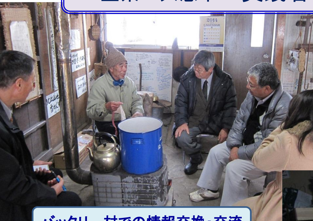
バッテリー村での情報交換・交流