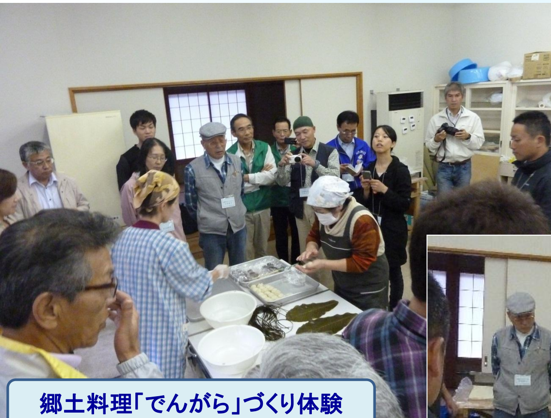
郷土料理「でんがら」づくり体験