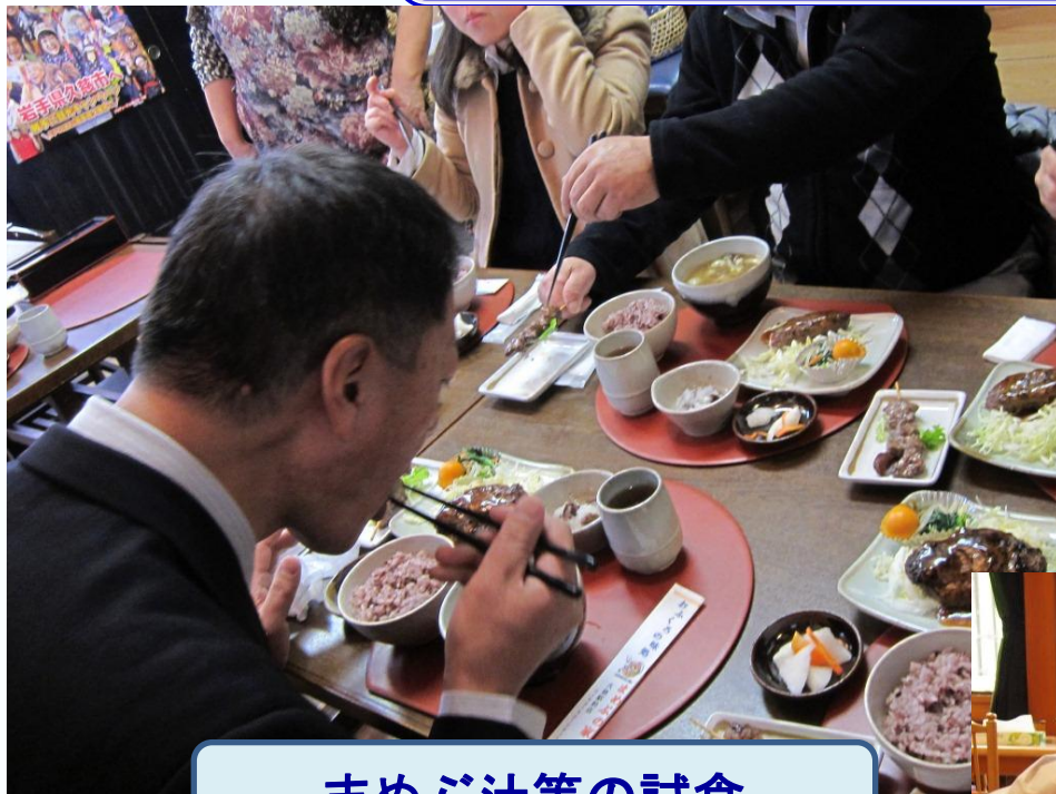
まめぶ汁等の試食