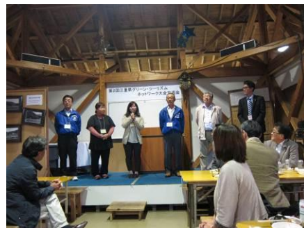
久慈市の実践者の方々