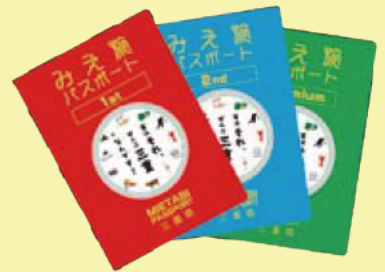
三重県観光キャンペーン 検索

必要なスタンプを集めると、ステータスアップする「みえ旅パスポート」。応募できるプレゼントがグレードアップします！