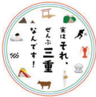
三重県観光キャンペーン 2013.4~2016.3

三重県では、今年10月、伊勢神宮において20年に1度の「第62回神宮式年遷宮」が集大成を迎えるとともに、来年は、世界遺産の「熊野古道伊勢路」が登録10周年を迎えます。観光キャンペーン実施中のこの機に、「みえ旅」を楽しんでみませんか。「みえ旅」をお得に満喫していただけるよう、特典満載の周遊バスポートを「みえ旅案内所」でご用意しています。三重県での思い出づくりの手伝いをさせていただきます。皆さんのご来訪を心よりお待ちしております。