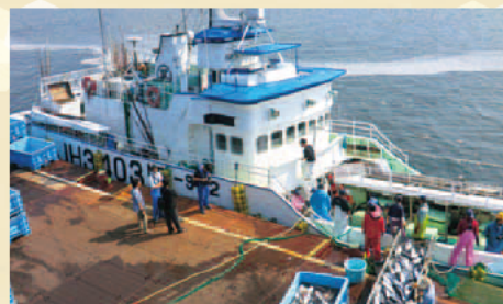
ご寄港に感謝! (復旧の進む気仙沼漁港: 三重県籍船のカツオの水揚げ) (気仙沼市)

☞ http://kokoropress.blogspot.jp/ 「ココロプレス」で 検索