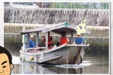
二軒茶屋と河崎に突撃