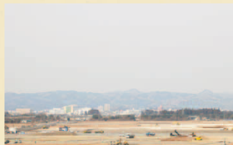
まちづくり造成工事の様子 (岩沼市)