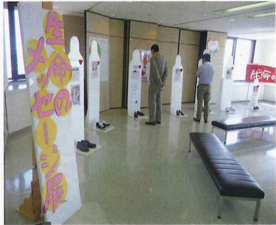
生命のメッセージ展