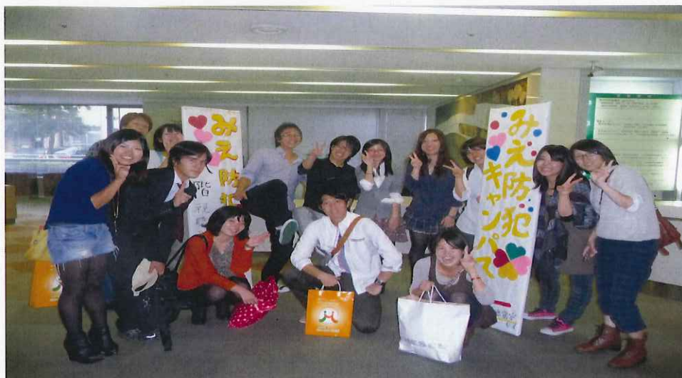
すべての行事を終えての記念撮影