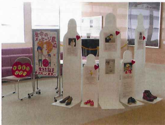
生命のメッセージ展