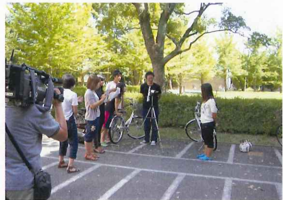
三重大学構内ビデオ作成