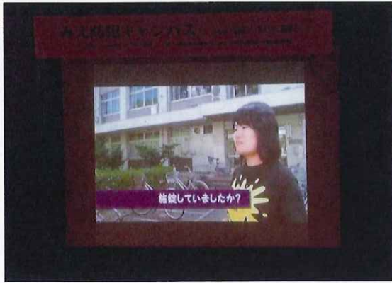
大学生制作ビデオ上映