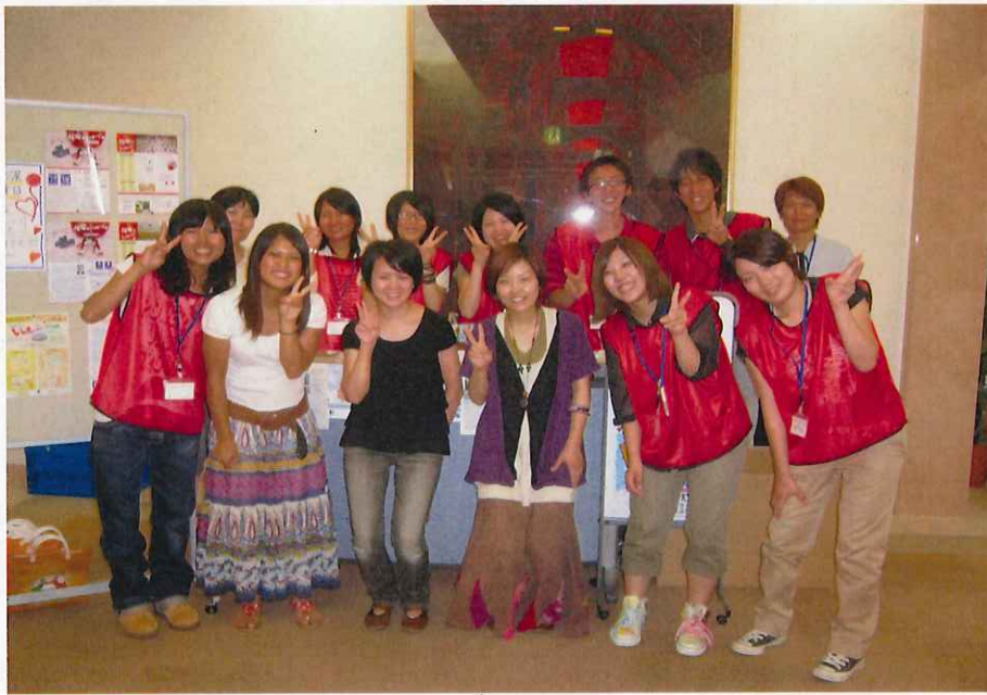
すべての行事を終えての記念撮影