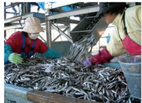
▲水揚げされたばかりの大量のカクチワシ