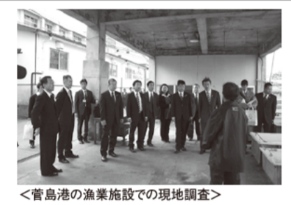
<鳥羽港の漁業施設での現地調査>