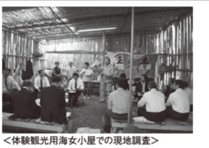
<体験観光用海水浴小屋での現地調査>

地域住民による、地域資源を生かした新たな取り組みについて現地で調査を行いました。