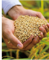
米の新品種「三重23号」

問 「三重の米（水田農業）戦略」は平成16年に策定されてから、一度も検証や見直しがされていません。戦略には取り組むべき課題などが詳細に明記されておられ、「もうかる農業」の実現には、これらの検証が不可欠と考えますが、戦略を見直す考えはありますか。また、見直した戦略の中で、県で開発した米の新品種「三重23号」をどのように生かしていくのかについても伺います。