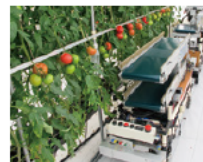
トマト収穫ロボット

問 みえ県民力ビジョンでは、「もうかる農林水産業」への転換を目指し、生産者、食品産業事業者、大学、行政などが知恵や技術を結集し融合することにより、新商品やサービスを革新的に生み出す「みえフードイノベーション」に取り組みむとしています。県の研究所がその「種」となる研究成果を生み出すことが重要です。今後どのような研究開発に取り組みますか。