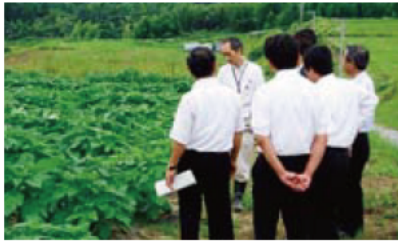
四日市市川島地区のゴマ栽培

また、広島県の農業経営と地域振興、島根県の企業の農業参入促進の取り組みなど、県外での調査も実施しました。