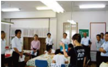
紀南ひかり園・グリーンプラザ

○子どもの権利を尊重する施策を推進するため「子どもの権利条例」(仮称)の制定を求めることについて ほか