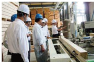
「新生産システム」を導入した木材加工施設

新県立博物館の整備、産業廃棄物対策、地球温暖化対策、RDF焼却・発電事業などの課題について調査し、委員からさまざまな意見や提案がありました。