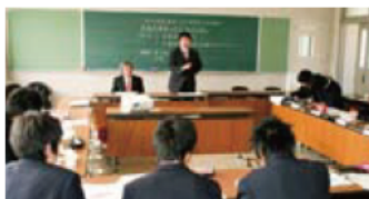
県立名張高等学校での出前講座（平成21年11月19日）

「なぜ、議員になったのか」「議員活動をしていてよかったと思う時は」など議員についての質問、「自分たちの意見を届ける方法」「学校の統廃合」の提案など、さまざまな意見や提案がありました。