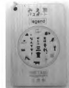
【記念木製プレート】