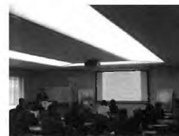
【平成25年度セミナー風景】