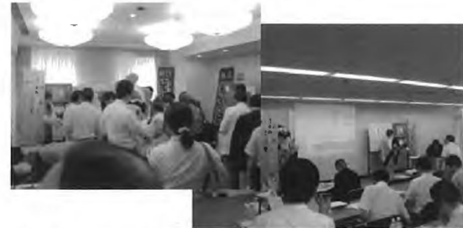
【平成25年度情報提供会風景】