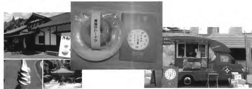
【みえ旅おもてなし施設でのサービス：割引・プレゼント等】