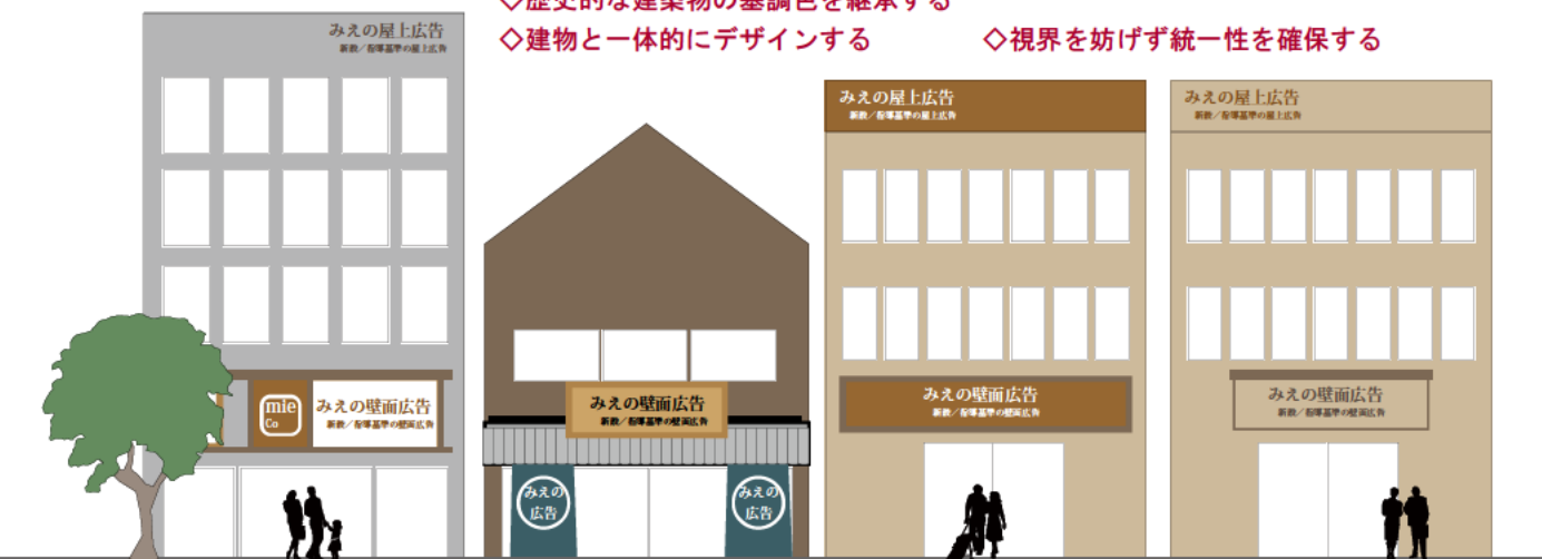
屋上広告と壁面広告のモデル