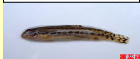
スジシマドジョウ小型種東海型