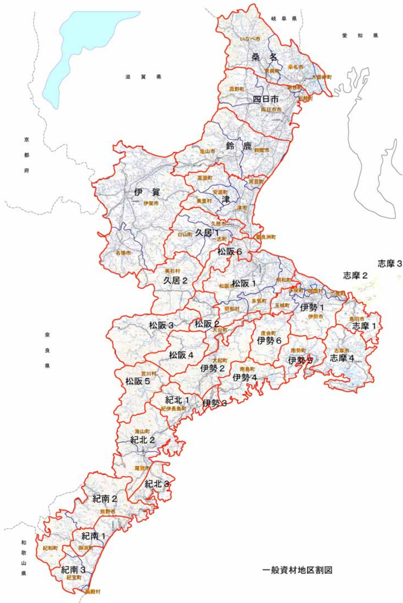
一般資材地区割図