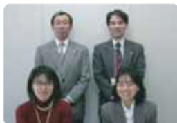
・ISO14001事務局 総務部人材政策室