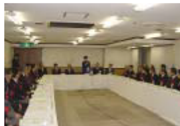
小池百合子大臣 あいさつ （東京都）

県民向けと職員向けの2分冊になっており、県民向けはわかりやすさを考慮したためか、ページ数も少なく、内容も概要版的な要素が強く、代表的な取組について写真を多用するなど読みやすい反面、データ・情報に乏しく、網羅性に欠けるところがあります。全体として、従来の行政が発行する報告書に比べデータは少ないかもしれませんが、ポイントを押さえコンパクトにまとめられており、読みやすく構成されています。初応募としては、まとまりのあるものとなっています。