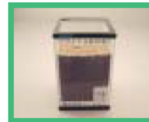
建設汚泥使用 の洗砂