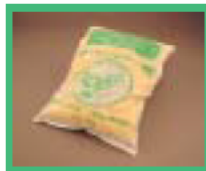
牛糞使用のたい肥