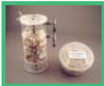
かき殻使用の 排水処理接触材