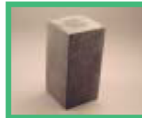
再生プラスチック の棒