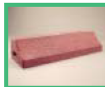
ゴムチップ使用の 車止め

※三重県リサイクル製品利用推進条例の内容及び認定リサイクル製品の概要・認定状況等は、ホームページ「三重の環境」( http://www.eco.prefmie.jp/ )でもご覧いただけます。