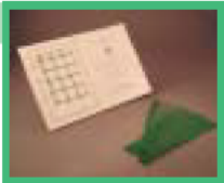
ペットボトル使用 の多目的ネット