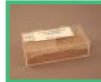
浄水スラッジ使用 の土壌改良材