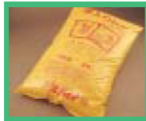
籾殻等使用の培土