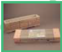
サイディング使用 のプランター