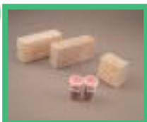
溶解スラグ等使用のイン ターロッキングブロック