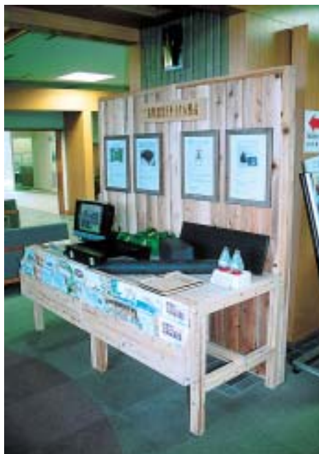
県庁の県民ホールでは認定リサイクル製品を展示しています。

循環型社会の構築を目指して平成13年3月に条例化されました。この条例に基づき平成14年度までに42製品を認定し、県での購入実績は、建設資材等で17製品約21,184千円でした。(資料編⑩参照)