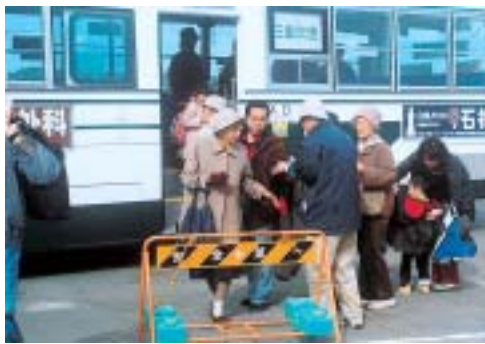
シャトルバスの利用