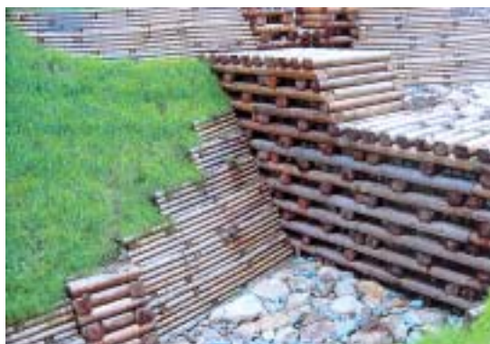
自然災害防止事業(飯高町)で間伐材を利用した治山施設

(3) グリーン購入の取組 イ 平成14年度目標と取組実績 ②公共工事 をご覧ください。