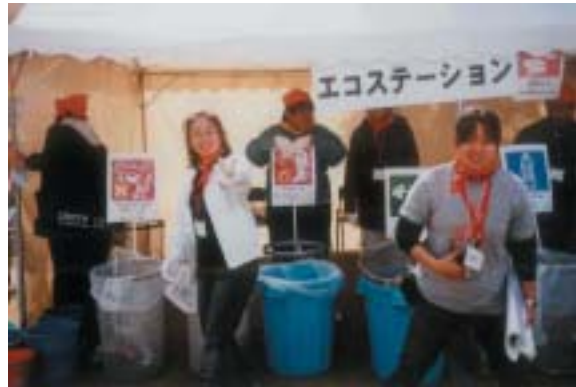
エコステーション (ゴミのナビゲーター)