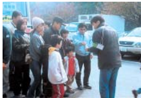
花の種入り抽選券配布