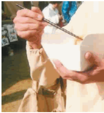
マイバッグ・マイ箸・剥離式トレイ