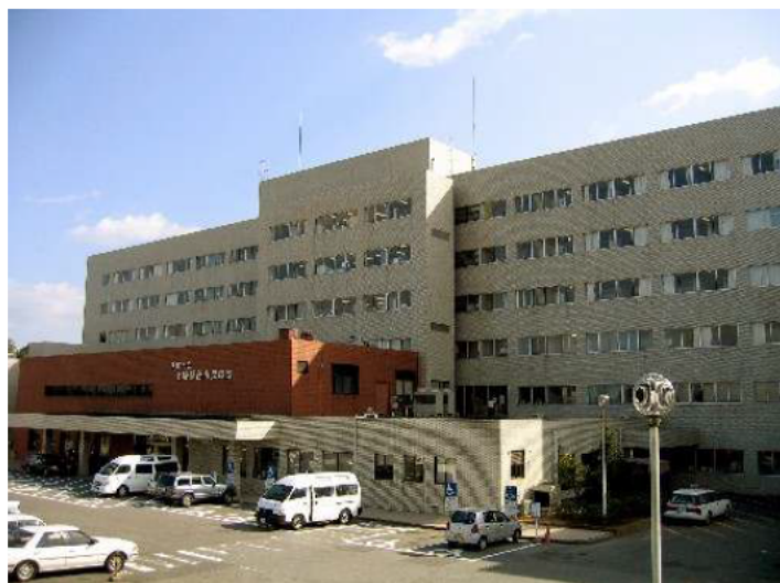
↑ 伊賀市立上野総合市民病院