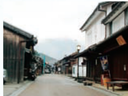
玉屋資料館（右手前）と町並み

大切な町並みを保存しようという運動が町民から生まれ、1984（昭和59）年に国の重要伝統的建造物群保存地区に選ばれました。