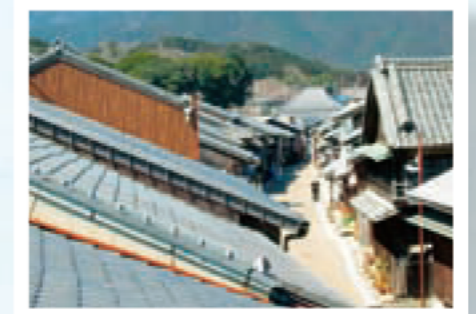
関町中町の町並み

関宿は、旧東海道の中で唯一歴史的な町並みが残ることから、1984（昭和59）年、国の重要伝統的建造物群保存地区に選定されました。その保存とともに、歴史的な町並みの特性を活かした新しい町づくりに取り組んでいるところです。