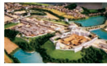
亀山城下の模型

関には、古代三関のひとつ「鈴鹿関」が置かれていました。鈴鹿関が歴史に登場するのは672年の壬申の乱の頃で、789（延暦8）年、桓武天皇によって廃止されました。その場所は関町新所とする説が有力で、2006（平成18）年、西の城壁と見られる築地が発見されました。