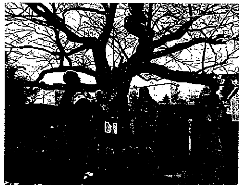
H23 樹木健康診断 四日市市小山田地区市民センター ソメイヨシノ