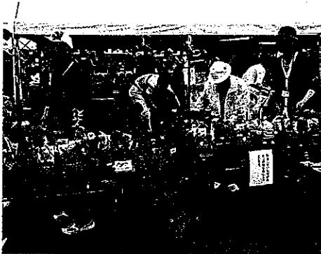
H24 春期緑化運動 明和町 緑のまちづくり推進委員会

※その他は、繰越金で翌年度に緑の募金が入金されるまでの期間、春期緑化運動経費等に使用します。