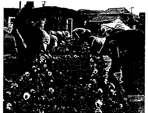
H23 緑の募金交付事業 伊勢市粟野区