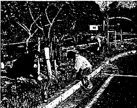
H23 緑の募金交付事業 志摩いそぶえ会