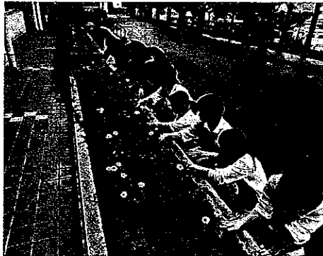
H24 春期緑化運動 大台町立大台中学校