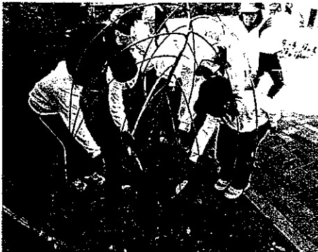
H23 緑の募金交付事業 津市立川合小学校