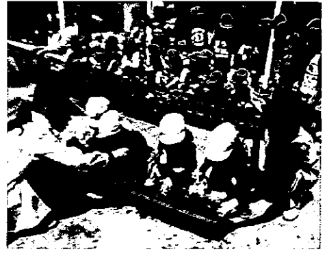
H25 春期緑化運動 伊勢市立保育所ゆりかご園