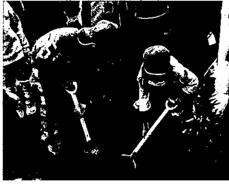
H25 春期緑化運動 津市立榊原幼稚園