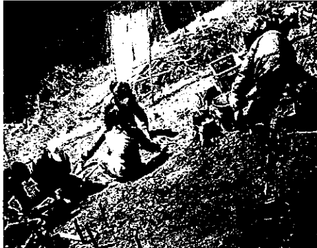
H24 緑の募金交付事業 大台町 宮川林業研究会