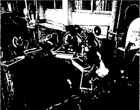
H25 春期緑化運動 志摩市立安乗中学校