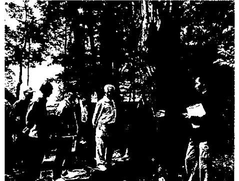
H24 緑地等適正管理事業 桑名市多度町