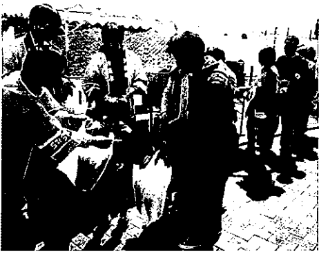
H25 春期緑化運動 鈴鹿市植木振興会

※その他は、繰越金で翌年度に緑の募金が入金されるまでの期間、春期緑化運動経費等に使用します。