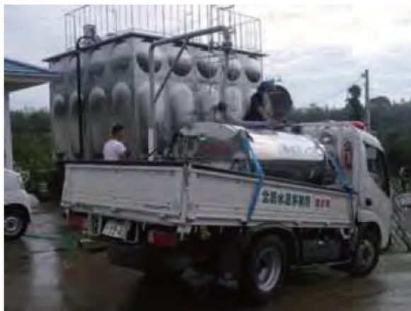
給水タンク補給状況