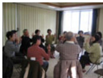
(予防ゲーム体験で楽しむ参加者)