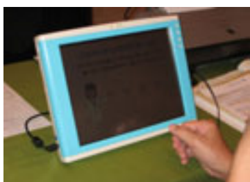
(タッチパネル式 スクリーニング機器)

単にスクリーニングのみを行うのではなく、個別に保健指導を組み合わせることで不安を与えることのないように配慮するとともに、15点満点中13点以下の方を予防教室へ誘うようにした。また、ミニ講座として脳活性化のゲームを体験してもらうことで認知症予防教室が楽しいものであることを伝え、先入観や抵抗感を取り除き、教室へ誘導しやすいよう配慮した。