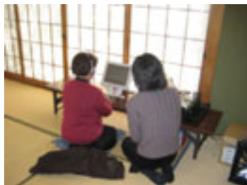
(質問をヘッドホンで聴きながら 画面をタッチして答える)