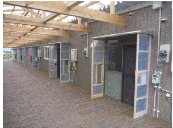
(右) ケアゾーンの仮設住宅