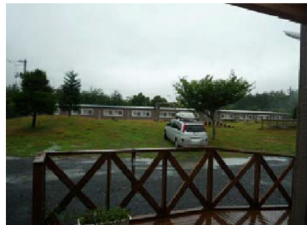
(左) 仮設住宅地全景 (右上) 一般ゾーンの仮設住宅 (右下) 子育てゾーン (公園一帯の広場)