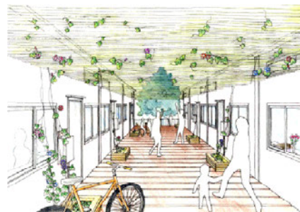
(上) ウッドデッキイメージ

などが配置される予定となっており、仮設住宅入居者の生活に資する機能を一体的に整備している。