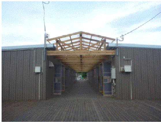
(左) ケアゾーンの仮設住宅 (正面)