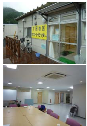
写真（上）サポートセンター外観、（下）集会室