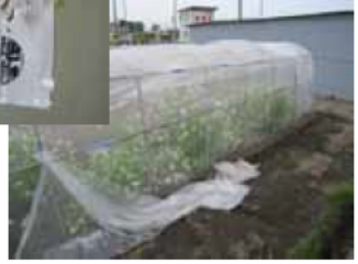
【御菌大根の系統選抜圃場】

生産者が安心して御菌大根の栽培ができる環境を整備するため、御菌大根栽培研究会と三井食品工業は協定価格により全量買取の規約を締結した。また、御菌大根栽培研究会は、三井食品工業が求める規格や品質の御菌大根を栽培するため、独自の系統選抜の実施や、生産者に対する栽培指針の提供、技術指導を実施した。一方、三井食品工業では、伝統的な伊勢たくあんの製法を守りながら、現代の食志向に合う味付けを実現することや、従来1年半～2年も要していた醗酵期間を短縮するため、新しい乳酸菌技術の開発を実施することで、これらの課題を解決した。