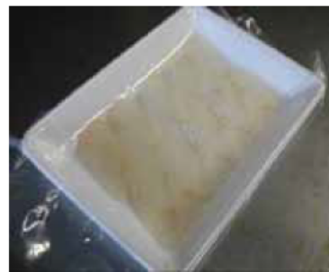
【ヒラメ寿司/業務用すしネタパック】

大一水産では、カクシン水産が選定した稚魚を自社の輸送車で輸送しカクシン水産に搬入する。カクシン水産は、搬入された稚魚を養殖する。養殖水槽は、地下水(真水)を配合することや屋内遮光することにより水温変化を抑制しており、給餌も最低限必要な量とし、水槽の養殖密度に十分な余裕を持たせるなどの取組みにより、ヒラメの健康状態に配慮することで、発病時に使用する抗生物質に極力頼らない養殖を実施する。カクシン水産で健康に育ったヒラメは、大一水産の溶存酸素量の高い生簀で保管され、全数が神経除去を行われるなど最大限の鮮度維持が図られる。また、加工段階において全数のクダア(寄生虫の一種)検査を実施することで、取引先が安心して消費者に提供できる商品を製造する。