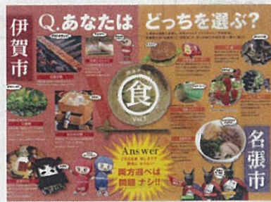
第1弾 エリアパンフレット(伊賀)