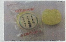
記念キャンディー