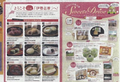
第1弾 エリアパンフレット(伊勢志摩)