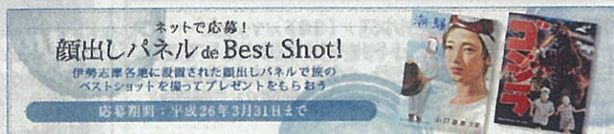
せんぐら旅博(伊勢志摩)

5つの地域部会（北勢地域、中南勢地域、伊勢志摩地域、伊賀地域、東紀州地域）において、テーマ性や訴求力のある地域の特色ある資源を活用した連携事業を開催