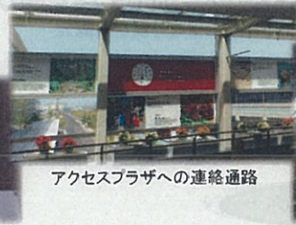
アクセスプラザへの連絡通路