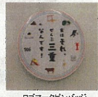
ロゴマークピンバッジ