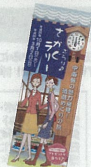
ぶらりさかくらりー(中南勢)