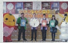
パスポート10万部発給記念イベント