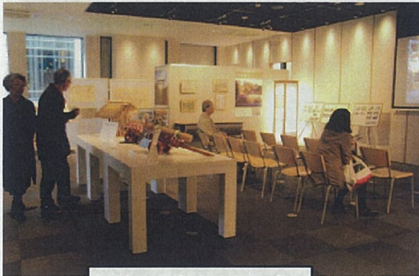
展示、ビデオの上映

日本橋で開催される「諸国往来市」のプレイベントとして、伊勢の今昔パネル展示やビデオの上映等を実施しました。