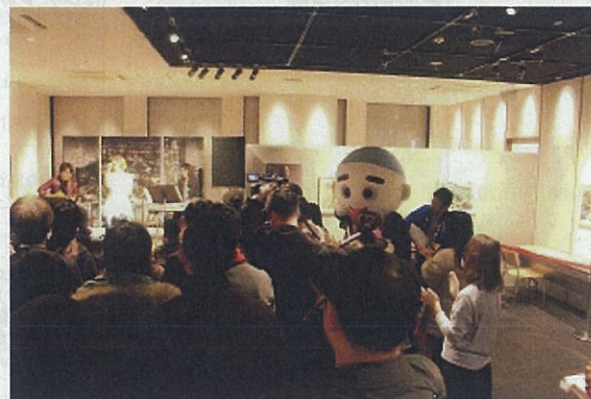
観光大使によるスペシャルライブ