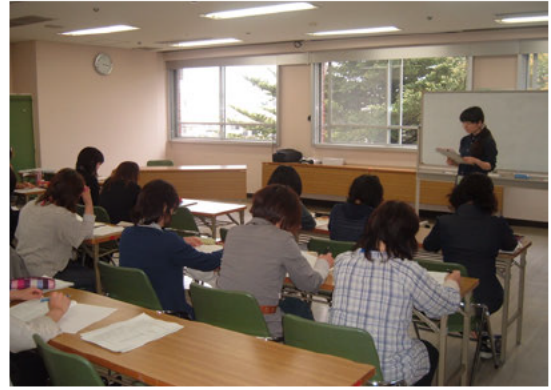
<研修会についての協議>