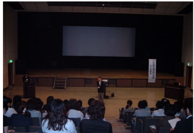
多気町民文化会館（南勢：多気町） 6月7日（木） 【71名参加】