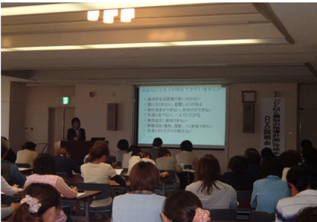
大安公民館（北勢：いなべ市） 5月31日（木） 【78名参加】

説明会では、講演で「CLMと個別の指導計画」の実施・作成方法について具体的に説明した後、実際にDVDを視聴して頂きました。4会場とも各市町から、保育士・幼稚園教諭・教諭・保健師・行政の方々がたくさん参加され、「CLMと個別の指導計画」に対する理解を深めて頂く良い機会となりました。