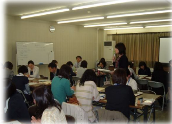
演習「事例検討」発表のようす

グループで話をする中で、色々な意見やアドバイスの切り口を学べる、日常の業務ですぐに活かせる内容、具体例について考えることがスキルアップに繋がる等々の声を多くいただきました。