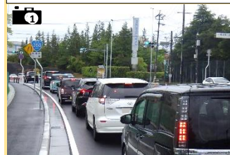
八幡工業団地1交差点付近の渋滞状況