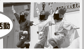
啓発活動を行う女性消防団員