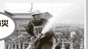
三重県消防操法大会