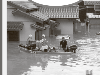
平成16年台風21号が三重県を襲った際の住民救助