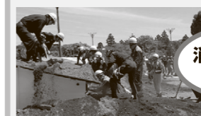
災害に備えた訓練