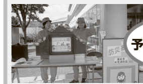
防災紙芝居で啓発活動を行う女性消防団員